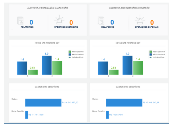
b) Tela de análise – parte 02